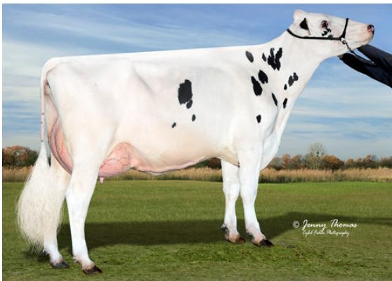
OCD RUBICON CAITLYN 4553 GRANDDAM