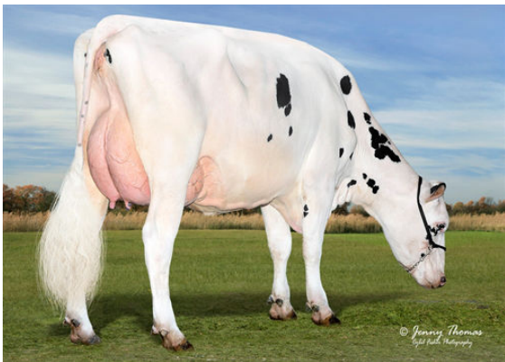
OCD RUBICON CAITLYN 4553 GRANDDAM