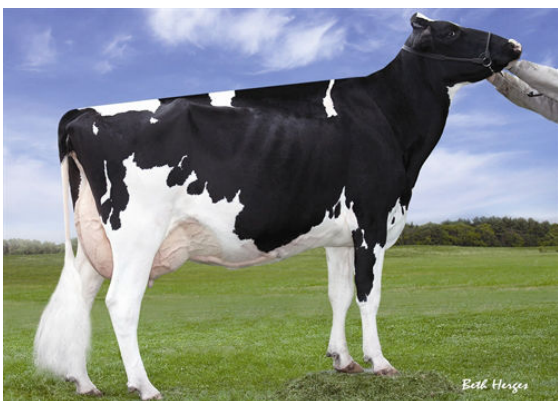
REGANCREST CHASSITY TY TL FIFTH DAM